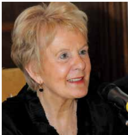
Madame Monique Gagnon-Tremblay

Durant le souper gala, madame Monique Gagnon-Tremblay est venue nous parler de son parcours. Membre de l'Afeas Ascot Corner dans les années 70, elle a été très engagée politiquement et devint la première femme de l'histoire du